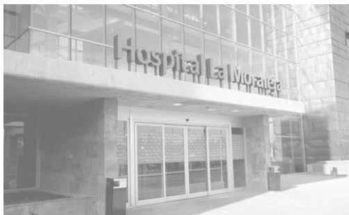
Hospital Sanitas La Moraleja