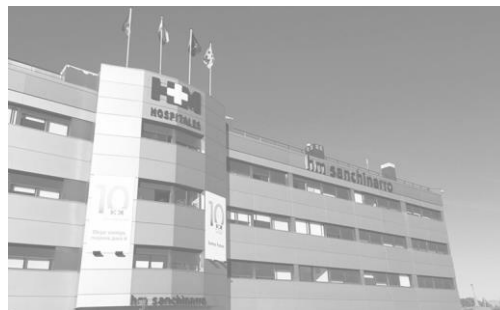
Hospital HM Sanchinarro