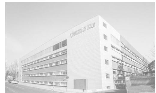
Hospital HLA Moncloa