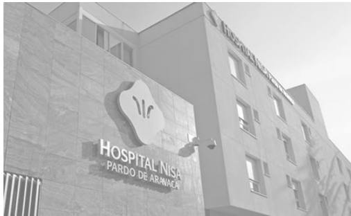
Hospital Vithas Nisa Pardo de Aravaca