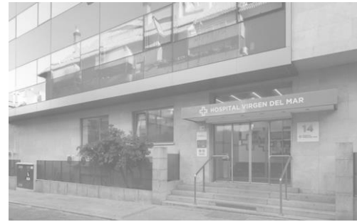
Hospital Virgen del Mar